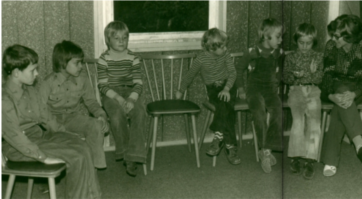
Kindergeburtstag (13. Oktober 1975)

Transparenter Bereich kann Beschnitten werden