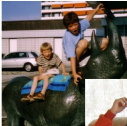
Sommer 2003 (heiß)