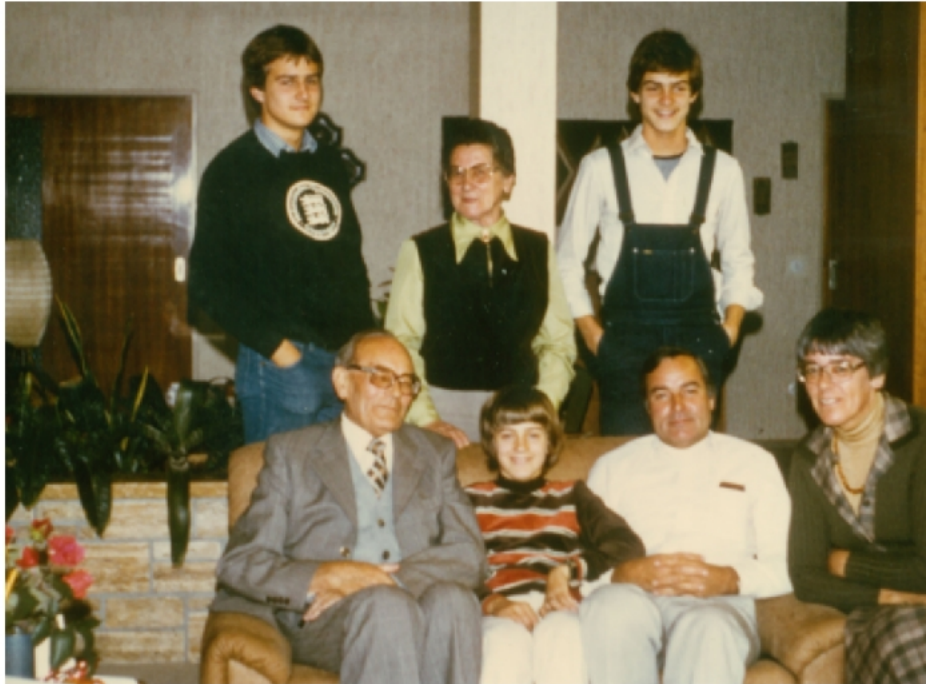
Geburtstagskindsofa (13. Oktober 1980)

Das Foto steht beispielhaft für viele Geburtstage. Das Geburtstagskind hatte seinen Tisch und für diesen Tag den Ehrenplatz auf dem Sofa. Das Schöne: wir können noch heute Geburtstage auf diese Weise feiern.