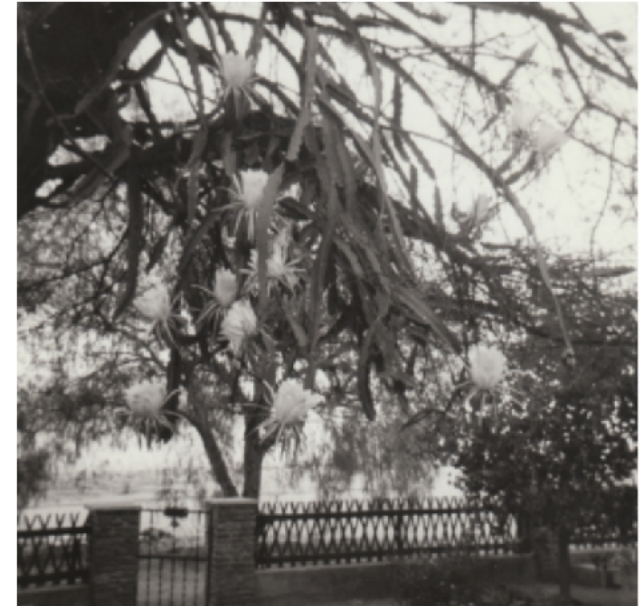
Königin der Nacht

Die Narbe ist geblieben. Der Bär auch. Er hat aber heute viel weniger Fell als damals.