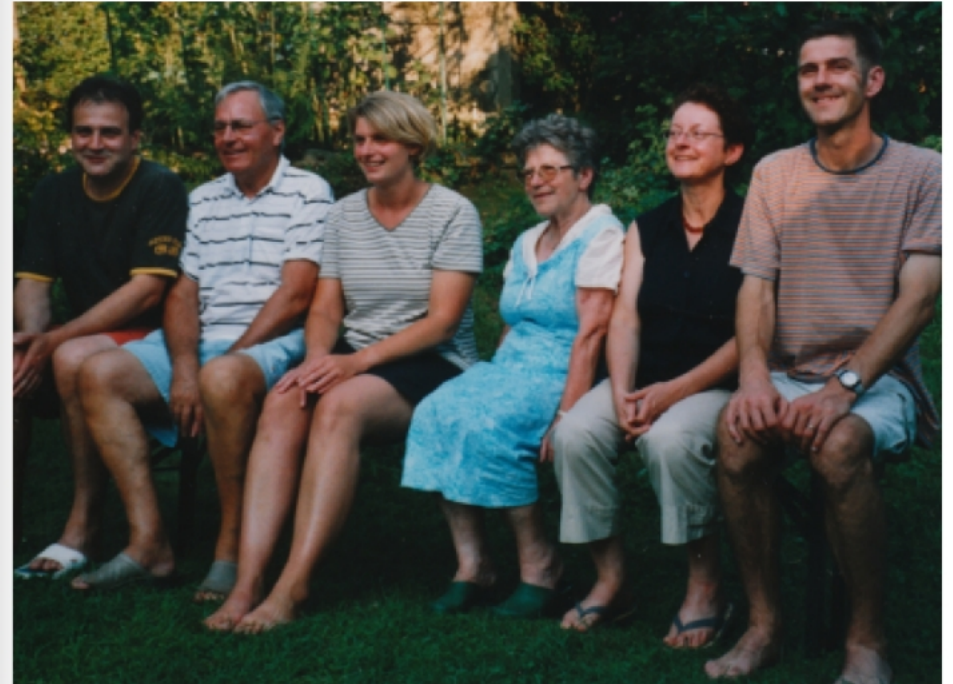
Familientreffen im Garten (8. März 2003)

Haus und Garten unsere Eltern waren immer wieder Treffpunkt für uns Geschwister. Dabei versuchten wir stets den aktuellen Stand festzuhalten. Je nach Tagesform sind auch die Kinder auf den Bildern zu finden. Hier aber (gilt nur für links oben): alle vollständig und nach Alter sortiert!