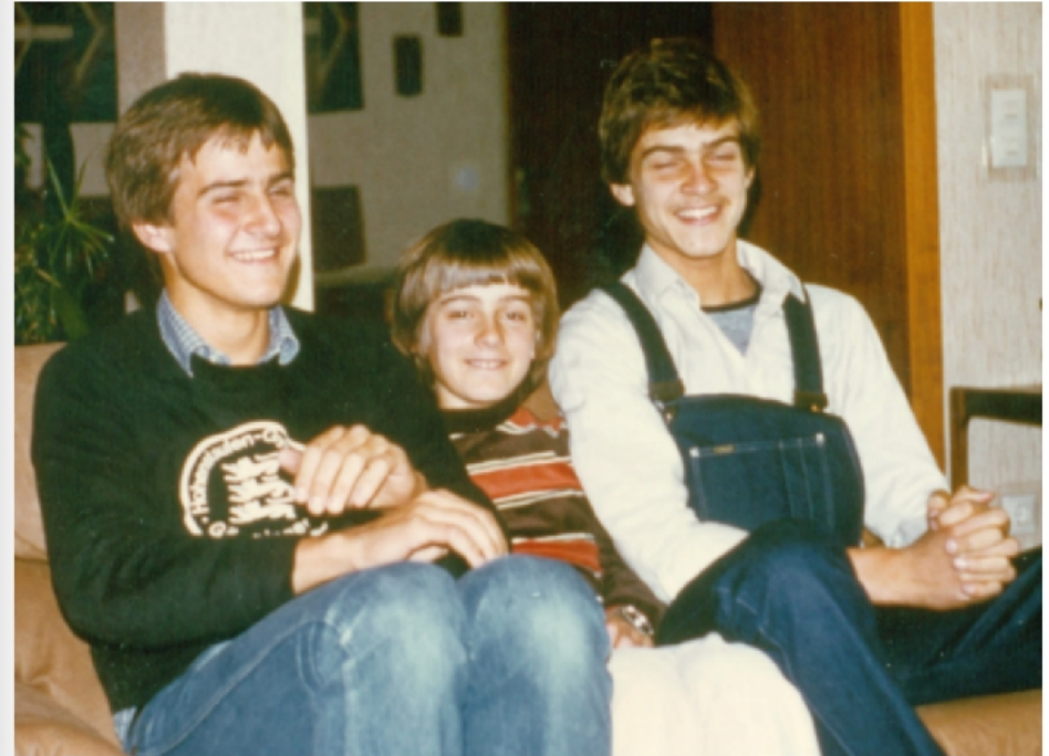
Gut behütet (13. Oktober 1980)

Das Foto steht beispielhaft für viele Geburtstage. Das Geburtstagskind hatte seinen Tisch und für diesen Tag den Ehrenplatz auf dem Sofa. Das Schöne: wir können noch heute Geburtstage auf diese Weise feiern.