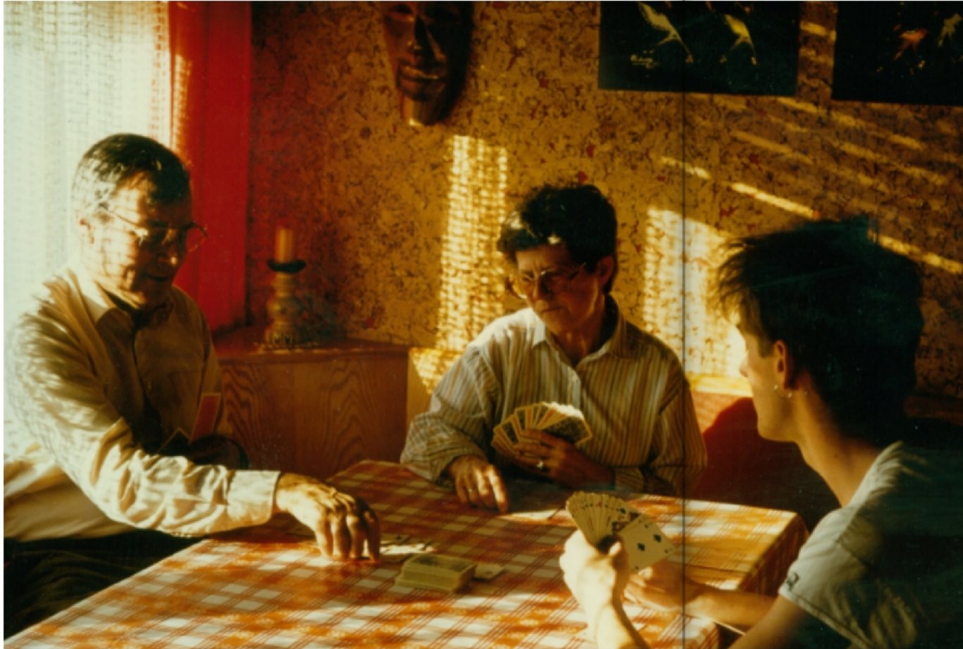
Unser Canasta (14. April 1989)

Canasta spielen gehört zur Familie wie das 'ai' im Nachnamen.