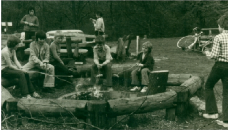
Feuer, Stock und rote Wurst (Juli 1976, Schwäbische Alb)

Viele Wanderungen hatten eine Feuerstelle zum Ziel. Jedes Mal wurde ein neuer Stock gesucht, mit dem Messer bearbeitet um dann die Wurst aufzuspießen. Rauch und Hitze waren die Gegner. Der Lohn für geduldiges Sitzen am Feuer war eine heiße und knusprige Wurst. Hatten wir Senf oder Ketchup dabei? Ich glaube eher nicht. Die Tradition aber lebt weiter.