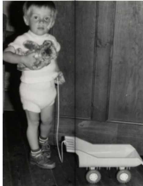
Bär Zotty und ein großes Pflaster

Die Narbe ist geblieben. Der Bär auch. Er hat aber heute viel weniger Fell als damals.