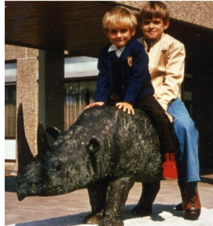
Nashorn vor dem Augustinum (Oktober 1973)

Vor jedem Besuch mussten wir einmal auf das Nashorn sitzen. Inzwischen ist der Rücken blank poliert.