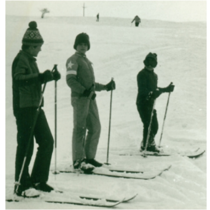
Schifahren ohne Schipass (Januar 1976 in Scheidegg)