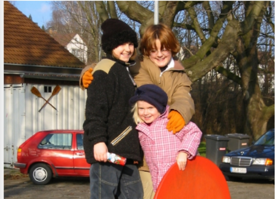
Unser griechisches Stammlokal (8. Dezember 2002)

Seit Jahren sind wir gerne Gast im griechischen Lokal "Turnerheim". Ich fand kein Bild das uns im Lokal zeigt. Darum eine Szene vom Spielplatz davor.