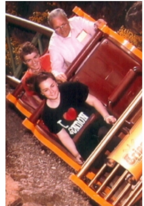
Geblickt! 24. April 2011, Tripsdrill

Auf der Suche nach dem Abenteuer kann es gar nicht schnell genug gehen. Dieses Foto bleibt aller- dings ohne Strafzettel.