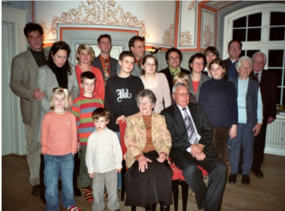
75er-Feier auf Schloss Filseck Korrektes Datum war: (12. Dezember 2008) 28. Dezember 2005 ! Ein großes Fest und ein Wiedersehen mit vielen Verwandten. Liebe Eltern, vielen Dank für die Einladung(en): wir feiern gerne noch oft mit Euch!